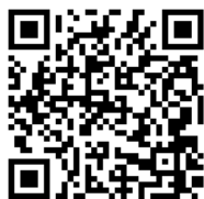
携帯サイト QR コード